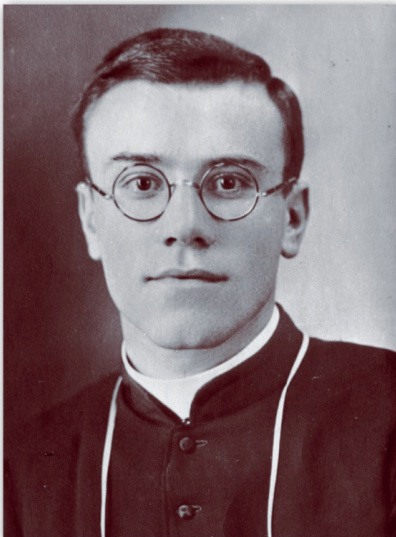
Missionnaire Martyr au Tibet