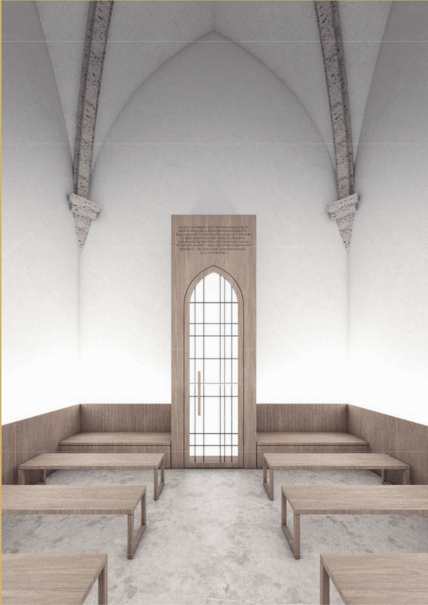
CHAPELLE DU BIENHEUREUX MAURICE TORNAVY