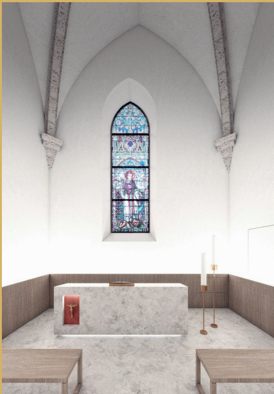
CHAPELLE DU BIENHEUREUX MAURICE TORNAY G A H C

L'aspect futur de l'intérieur de la chapelle dédiée au Bx Maurice Tornay (vue sur le chœur)