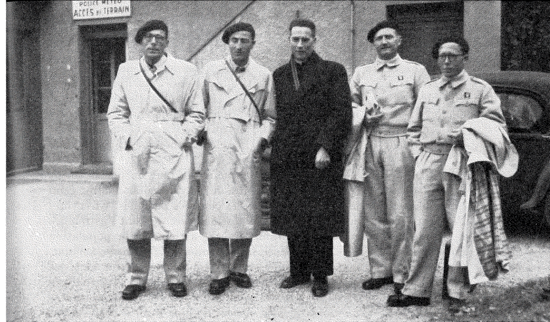
GENÈVE-COINTRIN 25 OCTOBRE 1946.

C'est un spectacle émotionnant de voir ces jeunes prêtres, au moment de leur départ pour les Missions lointaines. Une vie nouvelle s'ouvre devant eux, totalement différente de celle qu'ils ont connue